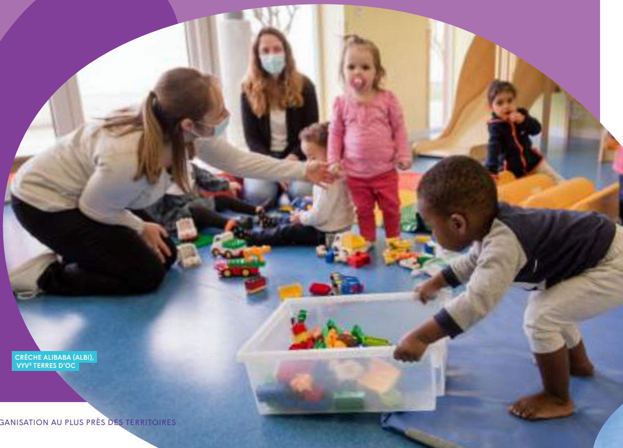
CRÈCHE ALIBABA (ALBI), VYV 3 TERRES D'OC

La force de VYV 3 réside dans son maillage et son ancrage territorial : en s'appuyant sur nos entités gestionnaires présentes dans plus de 81 départements, nous pouvons apporter des réponses spécifiques et innovantes aux besoins des populations locales en matière de soins et d'accompagnement.