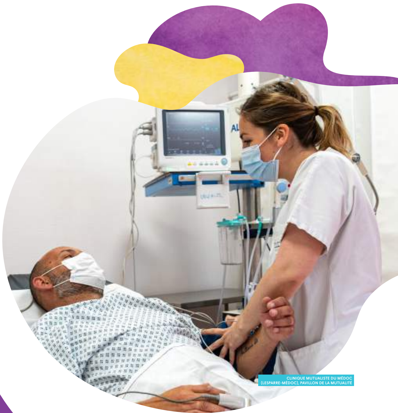
CLINIQUE MUTUALISTE DU MÉDOC (LESPARRE-MÉDOC), PAVILLON DE LA MUTUALITÉ