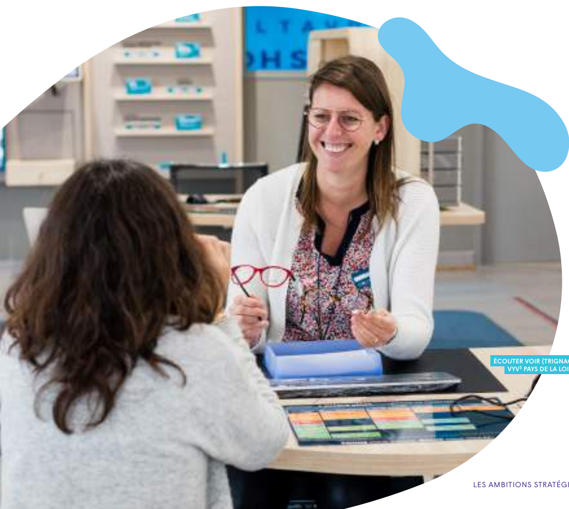
ÉCOUTER VOIR (TRIGNAC), VYV 2 PAYS DE LA LOIRE

Les feuilles de route stratégiques du Groupe VYV et de VYV 3 sont indissociables. Cinq ambitions prioritaires spécifiques à VYV 3 sont portées dans VYV > 2025 du fait de leur synergie forte avec l'ensemble des maisons du groupe.