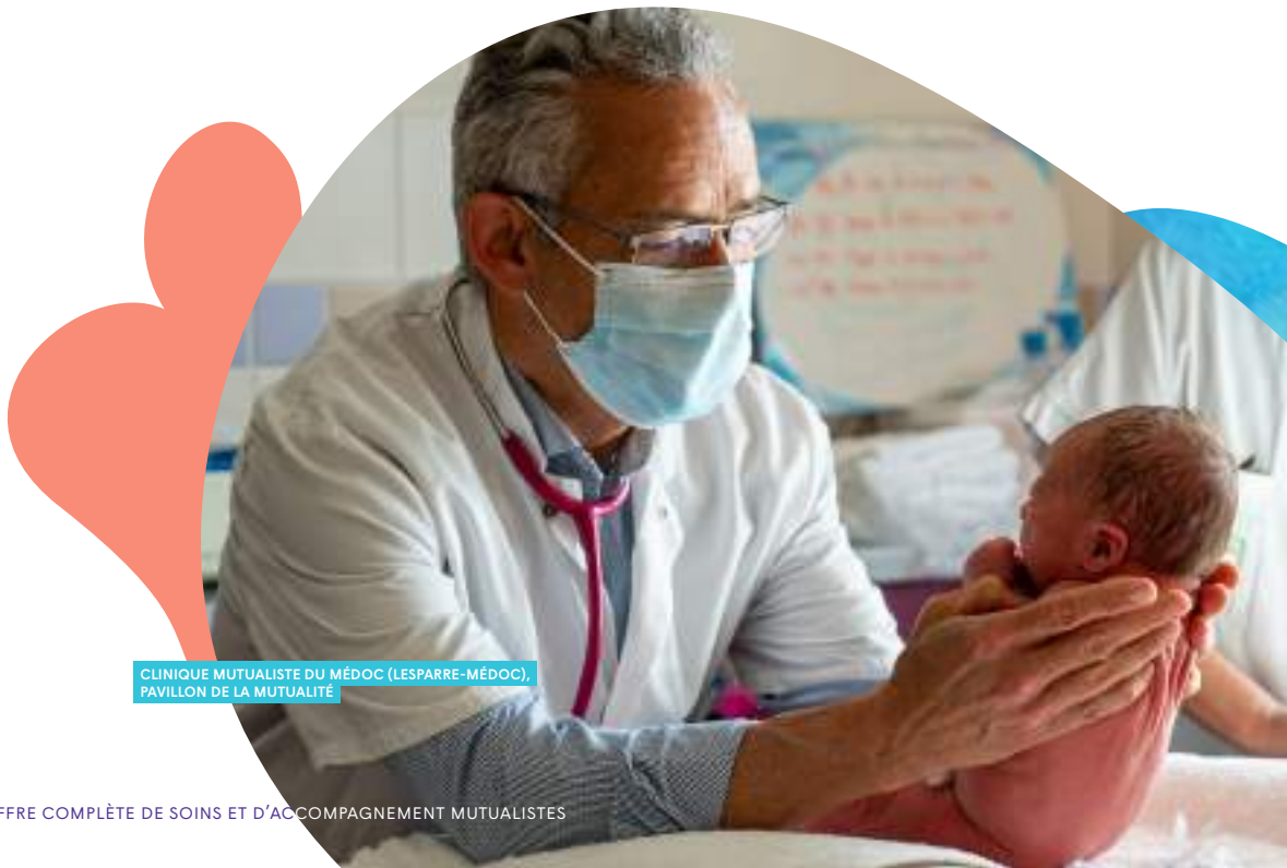
CLINIQUE MUTUALISTE DU MÉDOC (LESPARRE-MÉDOC), PAVILLON DE LA MUTUALITÉ

Nos activités sont réparties dans trois pôles métiers : soins, accompagnement, produits et services . L'innovation et la prévention sont des priorités que VYV 3 met au service de la qualité des soins et de l'accompagnement pour tous et tout au long de la vie.