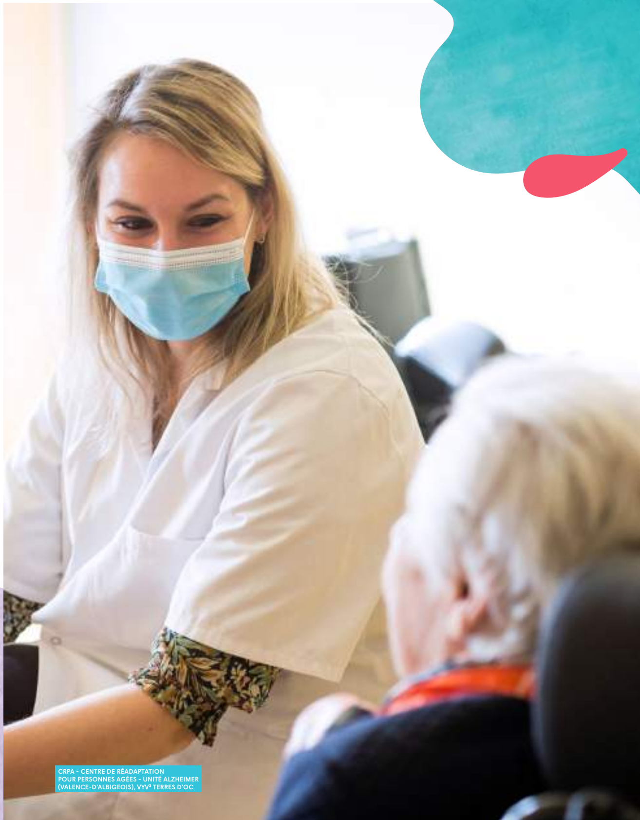
CRPA - CENTRE DE RÉADAPTATION POUR PERSONNES AGÉES - UNITÉ ALZHEIMER (VALENCE-D'ALBIGEOIS), VYV ® TERRES D'OC