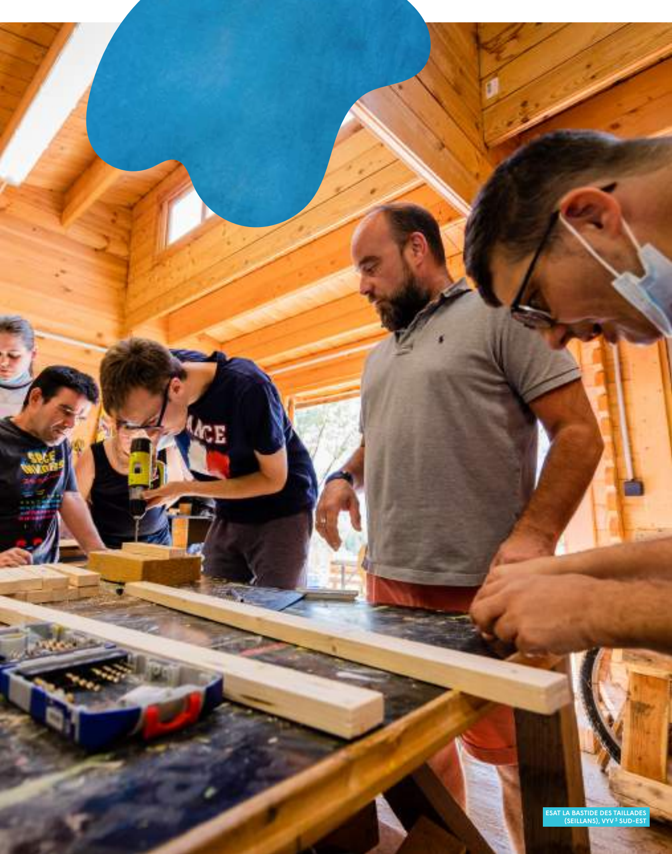
ESAT LA BASTIDE DES TAILLADES (SEILLANS), VVV 3 SUD-EST