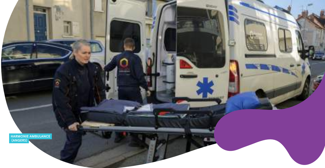
HARMONIE AMBULANCE (ANGERS)